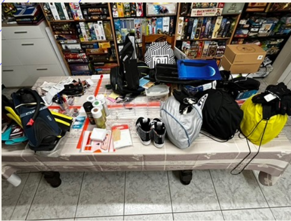
Seiri : le Tri