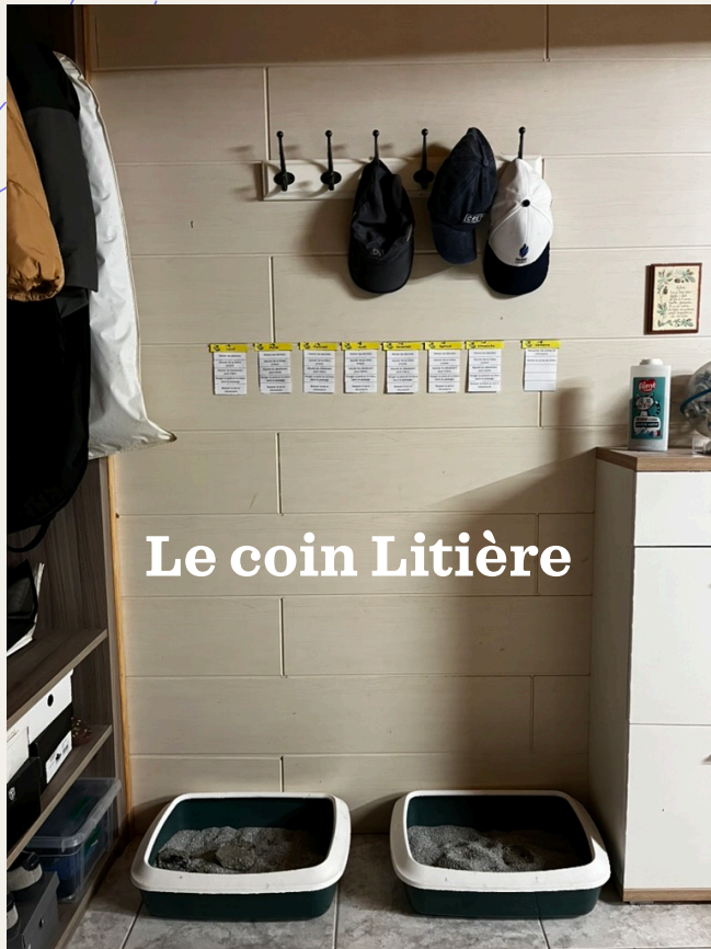
Le coin Litière