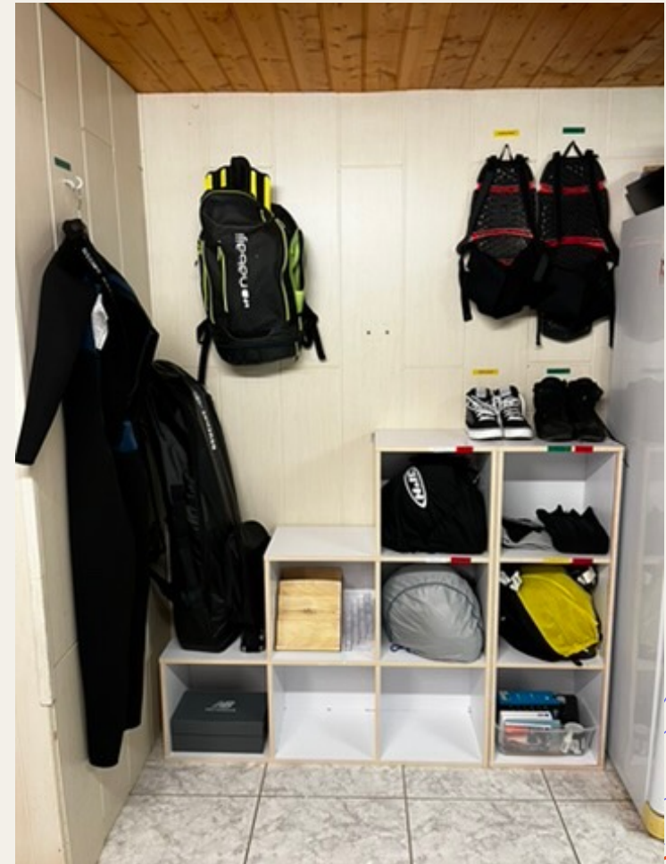
Seiso: le Rangement