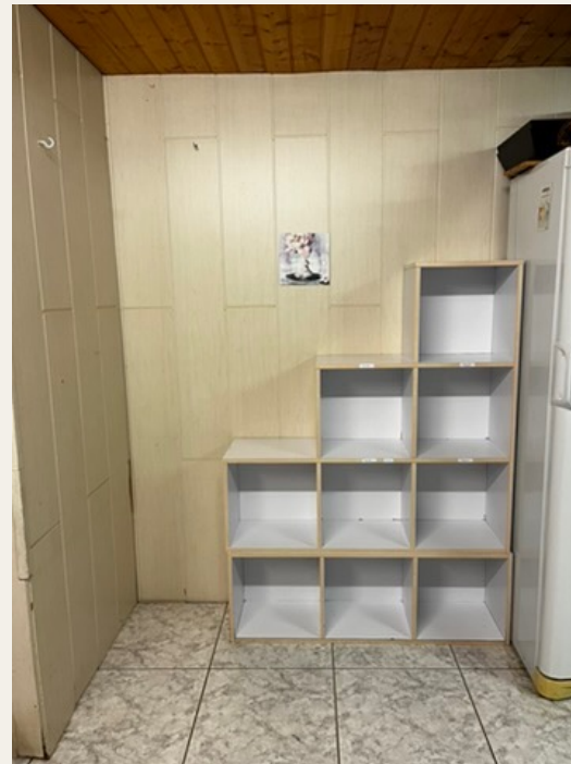
Seiso: le Nettoyage